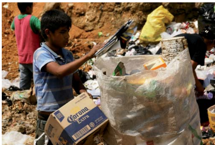
Basurero de Cobán en Guatemala.

Los recolectores y recicladores de basuras son, normalmente, los más pobres entre los pobres; un colectivo víctima de los prejuicios sociales, que ha de soportar el menosprecio, la marginación y los abusos. Migrantes que se han trasladado a las ciudades en busca de una vida mejor y terminan hacinados en barrios marginales carentes de los servicios más básicos. Viudas y ancianos sin recursos, discapacitados y niños. Familias enteras que, durante generaciones, no han conocido otro mundo que el de los desperdicios que les rodean.