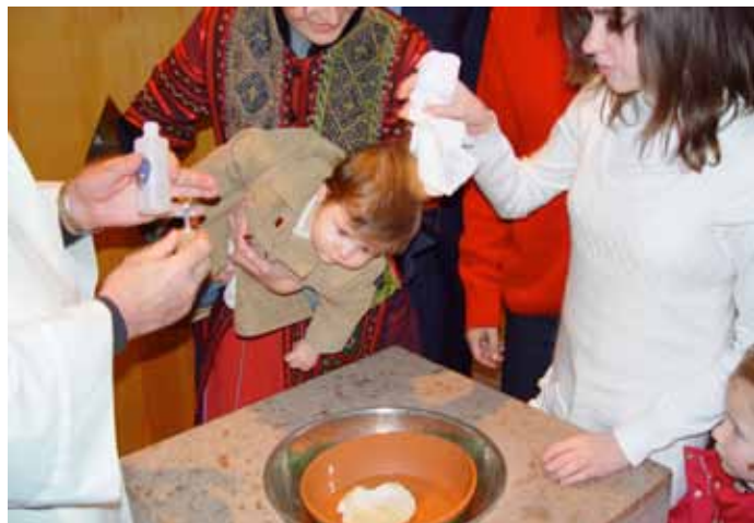
El primer bautizo, la primera boda... en tu parroquia

orar... Tú podrías ofrecerte para estar pendiente del templo y de sus visitantes una hora al día, o a la semana, o cuando puedas. Será un gran y valioso servicio.