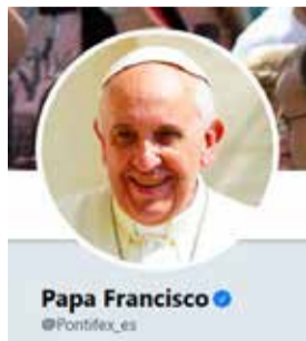
Papa Francisco @Pontifex_es