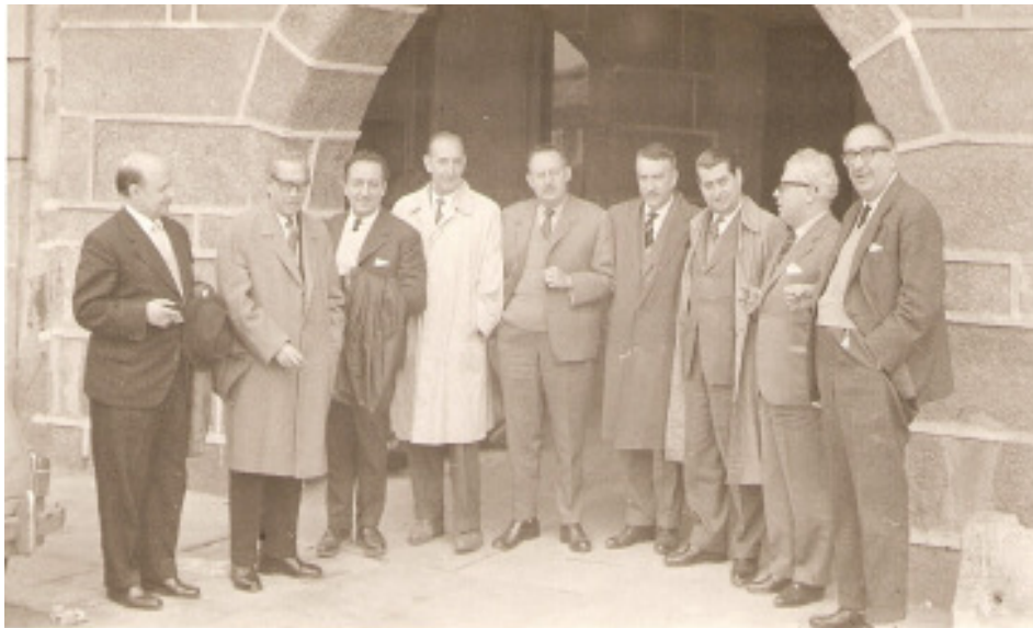
Escritores no Berbés (1961)