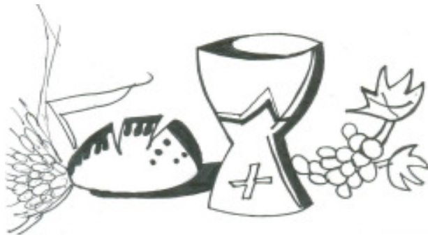
Debuxo de XAIROFORMOSOPENA, 3º ESO