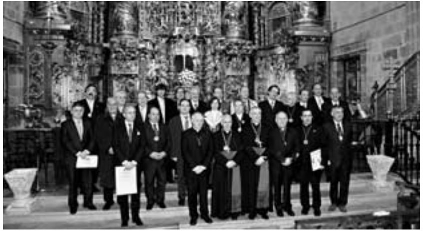
Los académicos posaron con los dos obispos patronos tras presentar la revista «Rudesindus»