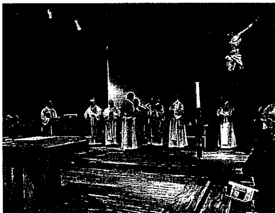
Imagen de los asistentes, un momento de la ceremonia religiosa y exterior del nuevo templo