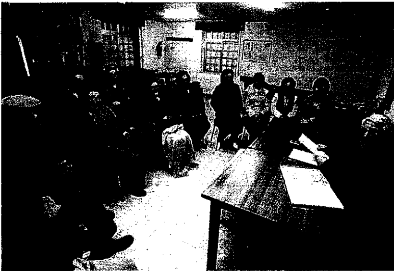
Un dos grupos de traballo, o de Papoi, durante a última sesión