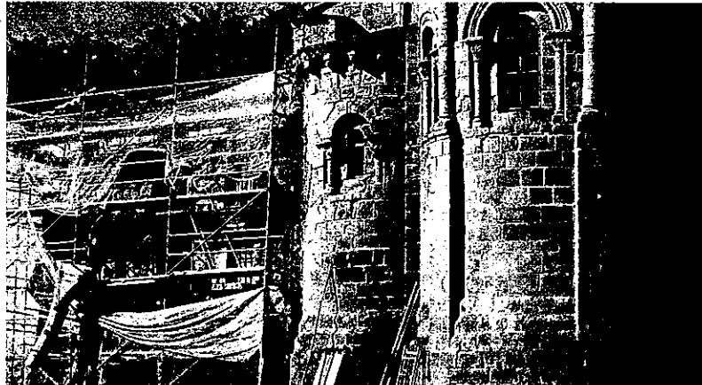
Cultura está actuando sobre los exteriores del monasterio, donde estudia los estratos de los muros

En lo que va de la actuación, ya ha habido sorpresas. Tras un friso de plástico, en el muro lateral de la sacristía superior, los operarios se han topado con una ventana incrustada en la pared pétreo. Unos metros más allá ha salido a la luz un pequeño habitáculo que los expertos creen que pudiera servir como despensa o almacén.