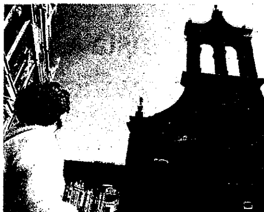
UN CAMPANARIO VACÍO. Imagen de la iglesia del cementerio de Covas (Ferrolterra) tras el robo de la campana en marzo de este año.

En Ourense, los ataques al patrimonio se centraron en el robo de dos tallas de madera, en el castillo de Monterrei, y en las pintadas realizadas en la catedral. Un vecino realizó además, sin autorización, obras en una capilla. La Policía Autonómica ayudará a los técnicos de Patrimonio en la vigilancia y persecución de estas agresiones.