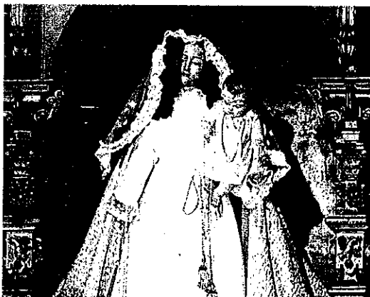
ROBO DE LA CORONA DE LA VIRGEN. Unos ladrones robaron en febrero varias joyas de las imágenes de la iglesia de Cangas. IJOÁN CARLOS GIL